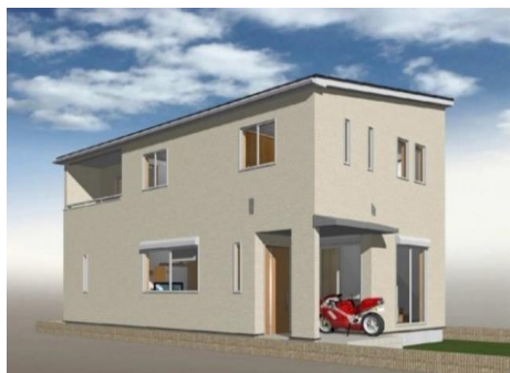
H区画 完成イメージ